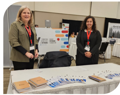
Colloque de vétérans Aspire & Inspire.