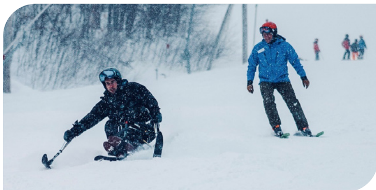
En sports adaptés, la pratique du ski alpin est possible grâce au handiski et à des bénévoles qui accompagnent les skieurs sur les pentes.

Ils ont représenté nos valeurs canadiennes dans le monde entier, ici comme ailleurs, en apportant de l'aide aux personnes vulnérables, en offrant la sécurité à ceux qui sont en danger et en faisant preuve d'empathie et de réconfort envers les populations stigmatisées.