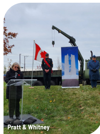
Pratt & Whitney