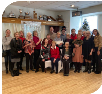
Dîner de Noël pour remercier les bénévoles de l'Hôpital Sainte-Anne