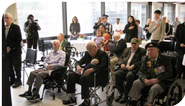
Remise de médailles par l'Ambassade de la République de Corée au Canada aux vétérans de la guerre de Corée à l'hôpital Ste-Anne.