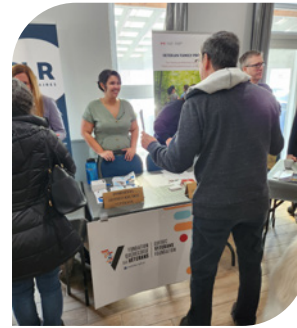
Salons des vétérans à Saint-Jean-sur-le-Richelieu