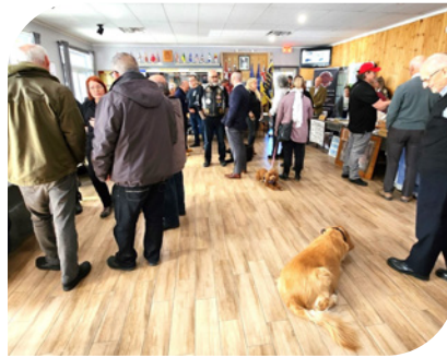
Salon des vétérans à Sherbrooke