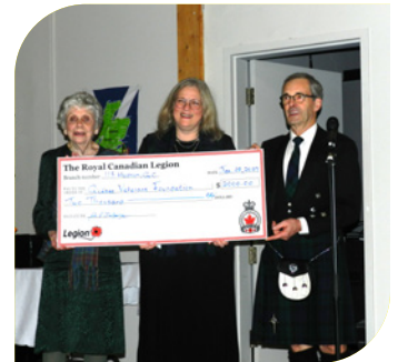
Soirée Robbie Burns à la Légion de Hudson