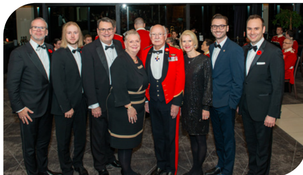
Le Dîner du Souvenir