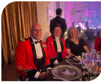
Militaires et vétérans au gala de la Fondation Barry F. Lorenzetti.