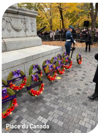
Place du Canada